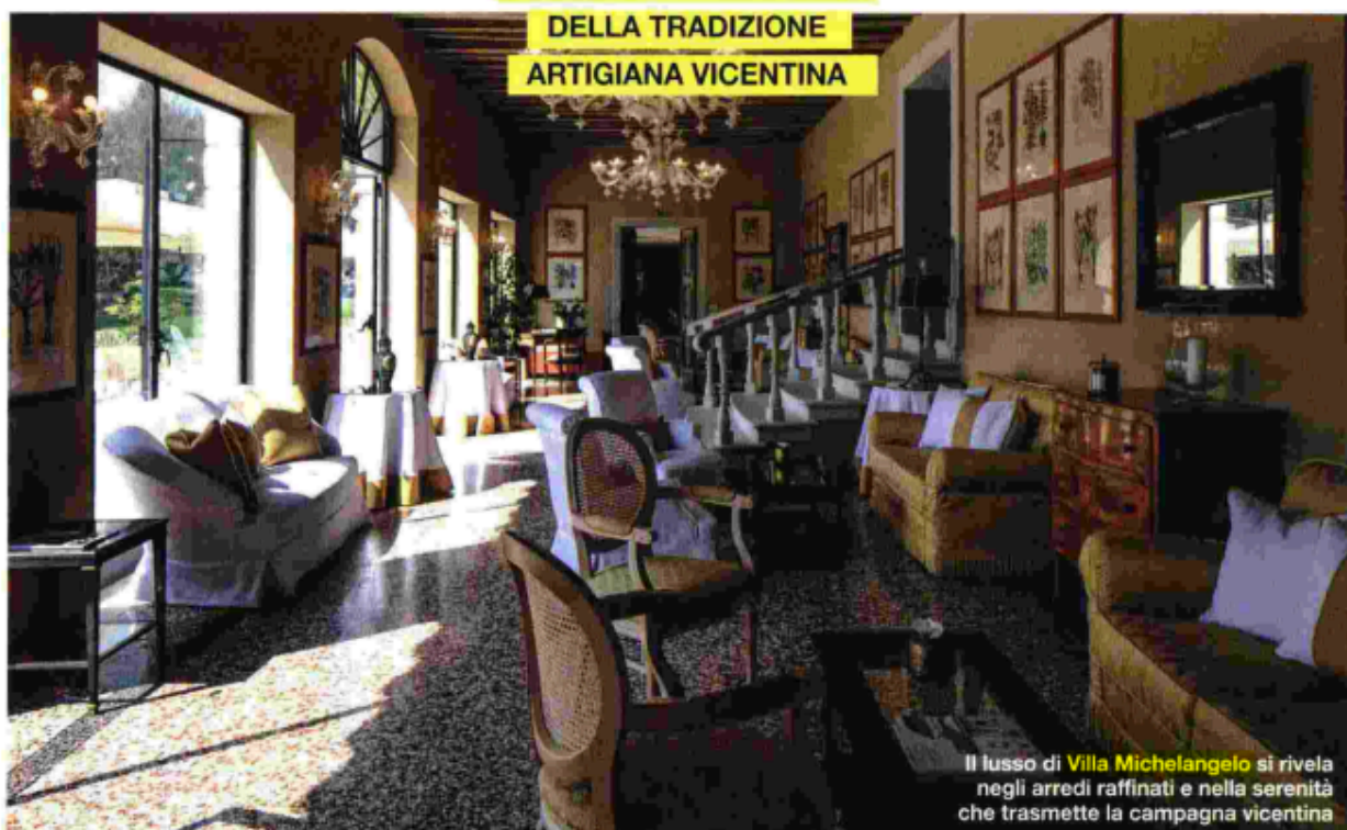
Il lusso di Villa Michelangelo si rivela negli arredi raffinati e nella serenità che trasmette la campagna vicentina

IMPORTANTE IL LEGAME CON IL TERRITORIO: LA STRUTTURA OFFRE DEI PERCORSI CHE PERMETTONO AGLI OSPITI DI ENTRARE NEL CUORE DELLA TRADIZIONE ARTIGIANA VICENTINA