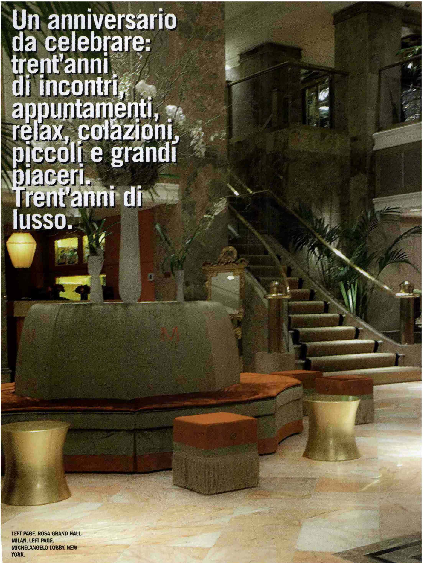
LEFT PAGE. ROSA GRAND HALL. MILAN. LEFT PAGE. MICHELANGELO LOBBY. NEW YORK.

Un anniversario da celebrare: trent'anni di incontri, appuntamenti, relax, colazioni, piccoli e grandi piaceri. Trent'anni di lusso.